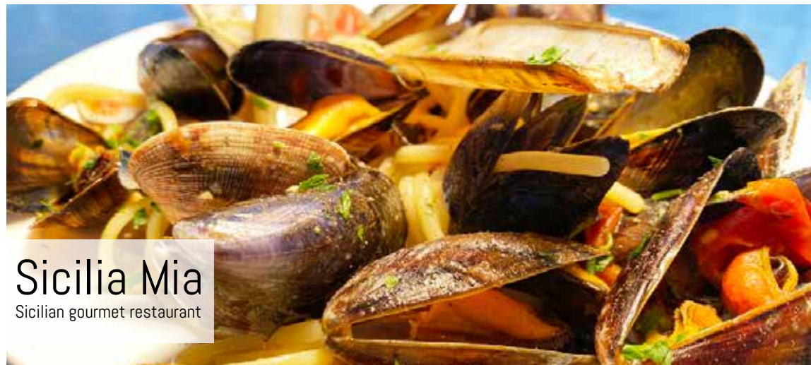
Sicilia Mia Sicilian gourmet restaurant